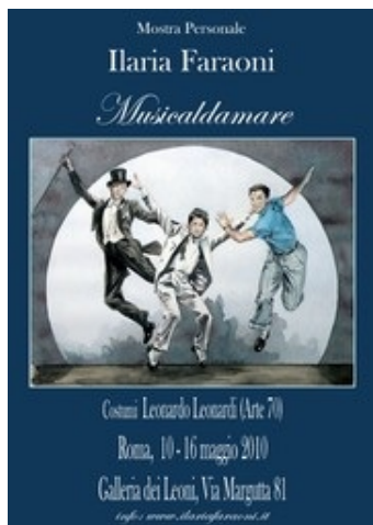
[Vedi la foto originale]